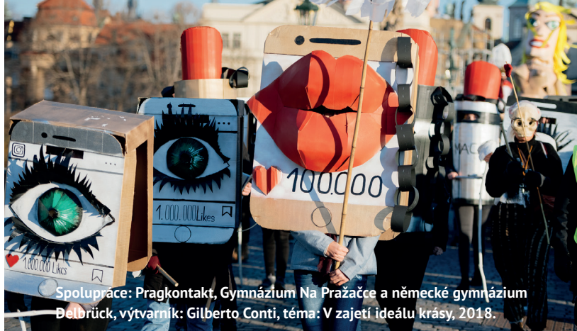
Spolupráce: Pragkontakt, Gymnázium Na Pražačce a německé gymnázium Dělbrück, výtvarník: Gilberto Conti, téma: V zajetí ideálu Krásy, 2018.

Sametové posvícení je satirický karnevalový průvod, který tematizuje nejrůznější aktuální společenské problémy. Už od roku 2012 slavíme Den boje za svobodu a demokracii a Mezinárodní den studentstva poukazováním na to, co podle nás nefunguje dobře a je třeba s tím něco dělat.